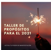
TALLER DE PROPÓSITOS