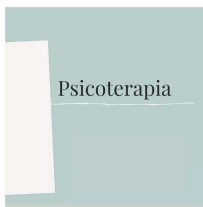
SESIÓN INDIVIDUAL DE PSICOTERAPIA