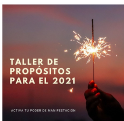
TALLER DE PROPÓSITOS