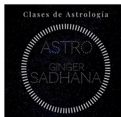
CLASE DE ASTROLOGÍA PERSONALIZADA

Los he diseñado con la intención de contribuir a tu desarrollo personal, autoconocimiento y sanación.