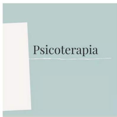
SESIÓN INDIVIDUAL DE PSICOTERAPIA